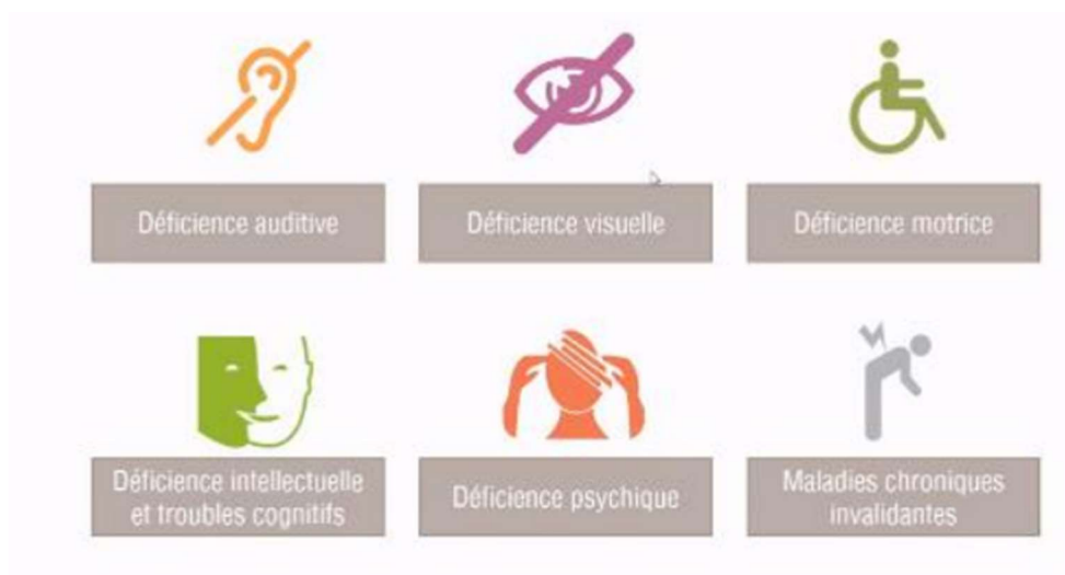
Figure 1 : les différentes catégories de situation de handicap

Les situations de handicap se classent en plusieurs catégories :